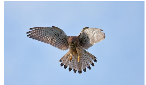
Abb. 1: Rüttelnder Turmfalke (Weibchen oder Jungtier)

Der Turmfalke ist eine Falkenart mit relativ langen Flügeln und langem Schwanz. Die Flügelbasis ist recht schmal, er hat eine gespreizte Flügelspitze, die eher stumpf ist. Er rüttelt häufig mit schnellen, flachen Flügelschlägen und hängendem, gefächertem Schwanz. Im Vergleich zu anderen Falkenarten hat er einen schnellen, lockeren Flug.